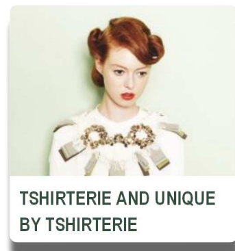
TSHIRTERIE AND UNIQUE BY TSHIRTERIE